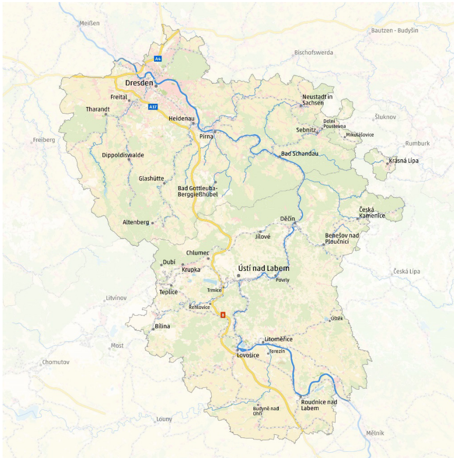
Gebiet der Euroregion Elbe/Labe