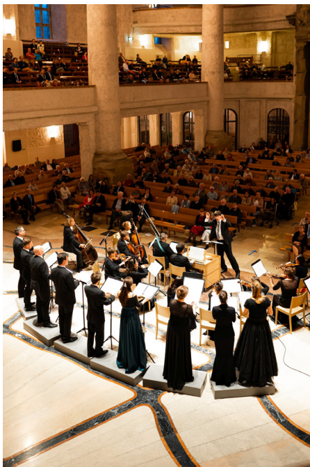
Eröffnung der 23. TDKT in der Kreuzkirche Dresden

Das Festival fand vom 1. bis 17.10.2021 statt und stand unter dem Motto „Heimat“. Damit sollte in Anknüpfung an das vorhergehende Jahr wieder ein Fokus auf Fragen von Identität, Geschichte, Minderheiten und nicht nur regionaler Verortung, sondern auch z.B. jener im politischen, historischen, sozialen oder künstlerischen Raum gelegt werden.