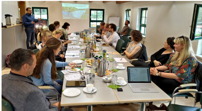
Fachgruppe Kultur, Tourismus, Naherholung am 07.09.2021 in Bad Gottleuba-Berggießhübel