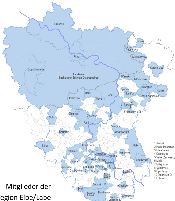
Mitglieder der Euroregion Elbe/Labe