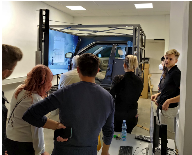
Fachgruppe Wirtschaft, Wissenschaft, Bildung besichtigt Fahrsimulator am 21.09.2021 in Děčín

Die Fachgruppe Wirtschaft/Wissenschaft/Bildung traf sich am 21.09.2021 in der Außenstelle der Fakultät für Verkehrswesen der Technischen Universität Prag in Děčín. Diese Einrichtung hatte im Rahmen eines Großprojektes im Rahmen des Kooperationsprogramms Sachsen-Tschechien Förderung für einen Fahrsimulator erhalten. Das Projekt sowie der Einsatz des Simulators wurden der Fachgruppe vorgestellt. Anschließend konnte der Fahrsimulator von den Teilnehmenden selbst getestet werden. Weitere Themen waren die Aktivitäten