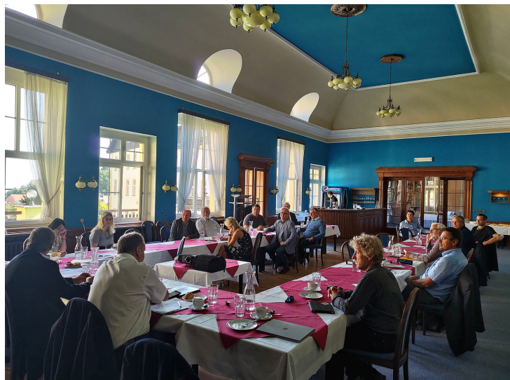
Sitzung des Rates der Euroregion am 09.09.2021 im Sanatorium Theresienbad in Dubí

Der Rat der Euroregion Elbe/Labe traf sich zur jährlichen Sitzung am 9. September 2021 im Sanatorium Theresienbad in Dubí. Neben dem Bericht über die Aktivitäten der vergangenen 12 Monate und einem Ausblick auf die kommende Arbeit war eine Entscheidung zur Verwaltung des nächsten Kleinprojektfonds notwendig. Nach Vorgaben der EU-Kommission darf der KPF in Zukunft nur noch von einer Stelle verwaltet werden, nicht wie bisher als Kooperationsprojekt von zweien. Im Gegensatz zu den anderen sächsisch-tschechischen Euroregion wurde beschlossen, die Verwaltung des KPF der tschechischen Seite zu übertragen.