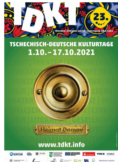
Plakatmotiv der 23. Tschechisch-Deutschen Kulturtage

Trotz der Kapazitätsbeschränkungen wurde diese Veranstaltungen von insgesamt etwa 2700 Menschen besucht. Neben der Eröffnung waren die Ska-Nacht in der Chemiefabrik mit ca. 270 sowie die Lesung von Jaroslav Rudiš im Verkehrsmuseum mit 110 Besucher*innen am besten besucht. Es ist gelungen, fast die Hälfte der Veranstaltungen außerhalb der Städte Dresden und Ústí nad Labem zu platzieren.